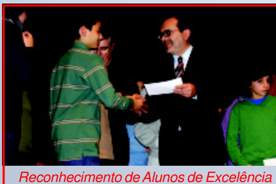
Reconhecimento de Alunos de Excelência