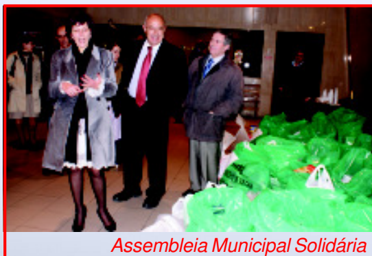
Assembleia Municipal Solidária