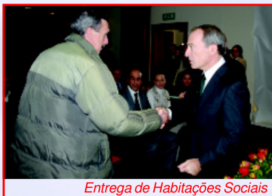
Entrega de Habitações Sociais