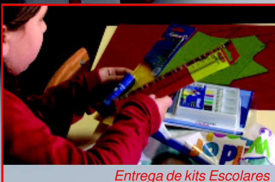
Entrega de kits Escolares