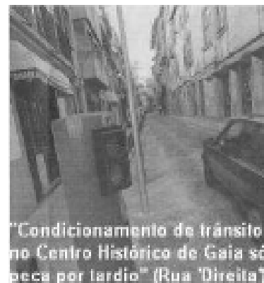
"Condicionamento de trânsito no Centro Histórico de Gaia só peca por tardio" (Rua "Direita")